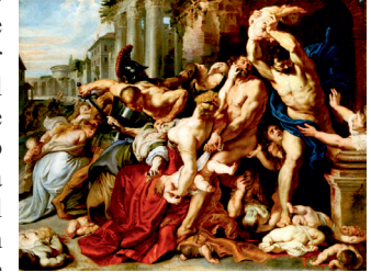
La matanza de los inocentes Peter Paul Rubens Flandes, 1612

Algunos escépticos han sugerido que si Dios es tan bondadoso y omnipotente, cómo pudo permitir semejante acto de barbarie sobre unos niños inocentes que murieron por culpa de Su hijo Jesucristo. Lo primero que conviene decir es que el culpable fue Herodes, no Cristo. Fue la perversidad y el pecado de un hombre malvado lo que provocó aquel infanticidio. Por el contrario, la misericordia de Dios se hace patente en la libertad que concede a toda criatura humana, con independencia de la moralidad de ésta. Y, sobre todo, en que siendo Dios se hizo voluntariamente hombre para salvarnos de nuestro pecado y de ese Herodes egoísta que todos llevamos dentro.