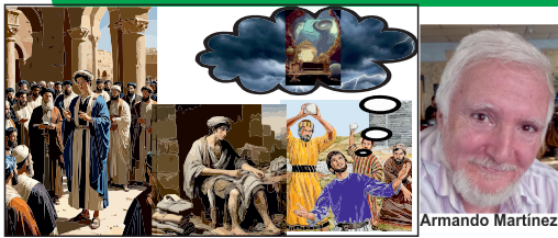
Personaje bíblico relacionado con estas imágenes