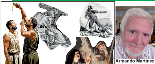
Personaje bíblico relacionado con estas imágenes