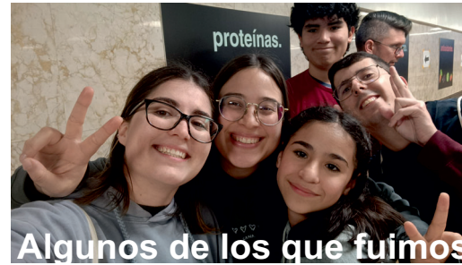
Algunos de los que fuimos

Fue una montaña rusa de emociones. Llegar tarde el primer día y perderme la primera plenaria me dejó un poco desanimada, pero después de la cena, las cosas empezaron a mejorar. Conocí a personas nuevas y me sentí muy cómoda en la plenaria. Los predicadores captaron mi atención de principio a fin con su mensaje, la verdad no quería irme de ahí.