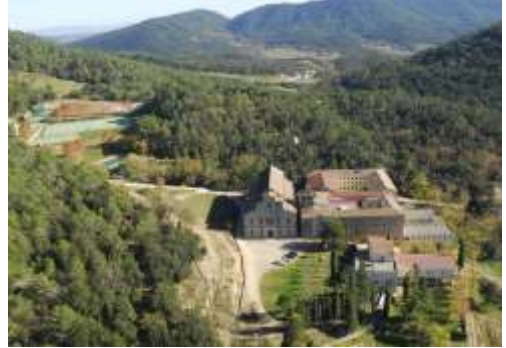
Sant Miquel de Campmajor, Girona