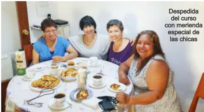
Despedida del curso con merienda especial de las chicas

Agradecer a todos los líderes su trabajo como dice Pablo: "Así que, hermanos míos amados estad firmes y constantes, creciendo en la obra del Señor siempre, sabiendo que vuestro trabajo en el Señor no es en vano" 1 Corintios 15:58