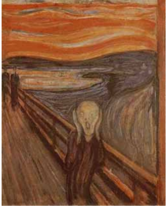
"El Grito" de Munch, quien pintó más de 50 variantes de este cuadro

Si hojeas un libro sobre Edvard Munch verás que los sensibles y hermosos cuadros que pintó antes de 1.891 son irreconocibles al lado de las obras chocantes de otros periodos. Esto no es de extrañar ya que Munch afirmaba que sus pinturas reflejaban el desarrollo de su vida y sus inquietudes, lo que él llamaba "la anatomía del alma." Vamos a mirar su cuadro más conocido, El Grito , pintado en 1.893. Munch describe las circunstancias que llevaron a esta obra así: "Caminaba con dos amigos por la carretera, entonces se puso el sol de repente, el cielo se volvió rojo como la sangre. Me detuve, me apoyé en la valla, indeciblemente cansado. Lenguas de fuego se extendieron sobre el fiordo negro azulado. Mis amigos siguieron caminando, mientras yo me quedaba atrás temblando de miedo y sentí el grito enorme, infinito, de la naturaleza." Así que estamos mirando al mismo Munch, a un hombre solo ante un mundo amenazante y incómodo. En este periodo también pintó varios Madonna donde representaba a lo que sólo se puede llamar un cadáver. Con su obra estamos presenciando la muerte de una cultura a través de los ojos de un hombre profundamente inquieto.