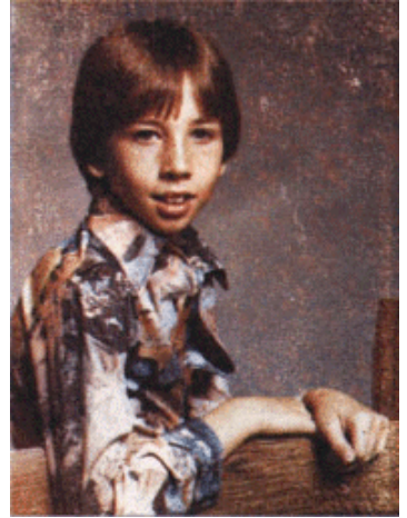
Brian Warner a los 14 años

“¿Ha escuchado de él últimamente?” No, le respondió el pastor... “¿Usted sabe quien es ahora?” El estudiante le dio una pista. “Bueno, el no es más Brian Warner” El pastor quedó medio cortado... Y el estudiante le dijo: “Brian Warner es ahora Marilyn Manson”.