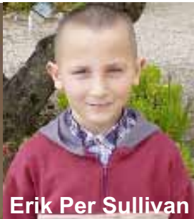
Erik Per Sullivan