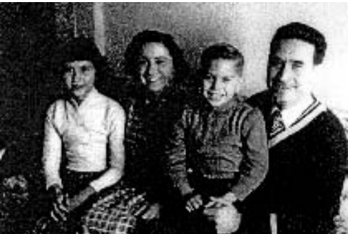
El Sr. Y la Sra. Figueras con sus dos hijos

Ha sido el siervo de Dios que ha sido fiel a su llamado, y se ha