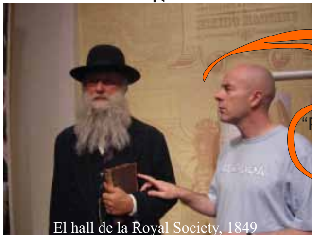
El hall de la Royal Society, 1849

“Públcalo si quieres. Pero esto no quedará así.”