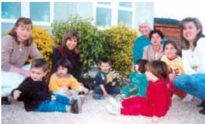
Grupo de mamás y sus bebés.

“La idea surgió a raíz de la congregación inglesa, ya que tanto en Inglaterra como en el Norte de Europa el hecho de reunirse las mamás, tomar café y que los niños jueguen es muy común. Empecé a ir con ellas y me encantó, pero a las madres españolas que yo invitaba, no les iba bien por el horario, así que Dios me retó a crear un “Club de mamás y bebés