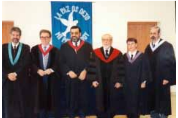
Profesorado del CEIBI en el Seminario Presencial