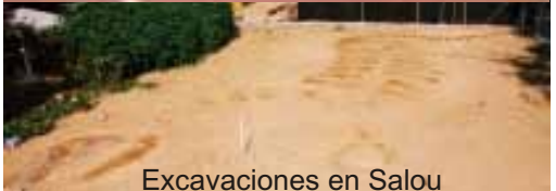
Excavaciones en Salou